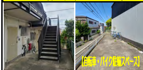
[自転車・バイク駐輪スペース]

★インターネット無料導入工事中★ ★月額利用料「約5,258円分」が 「無料0円」でお得！★ (差引実賃料合計 約30,000円と同等)