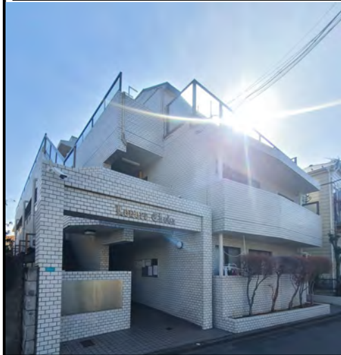
<原状回復工事&設備交換完了>